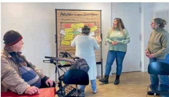
Was alles könnte man zusammen im Gemeinschaftsraum tun? Die Pinnwand füllte sich ziemlich schnell mit guten Ideen.