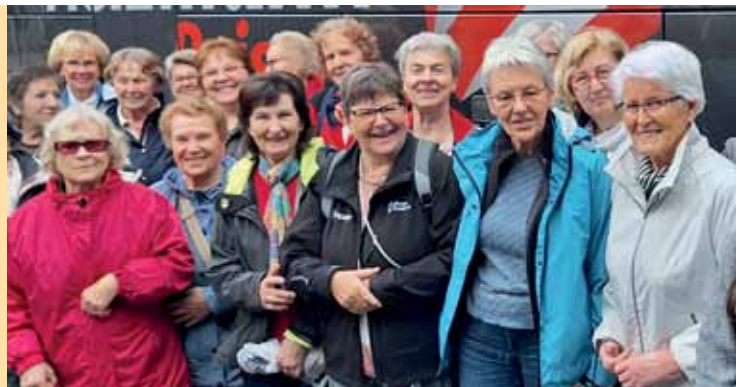
Gerne zusammen unterwegs: Mieterinnen voriges Jahr in Mulhouse.

Wenn Sie Fragen haben oder sich gerne an der Vorbereitung der Feste beteiligen wollen, freut sich das Team Soziales Management über Ihren Anruf oder Ihre E-Mail.