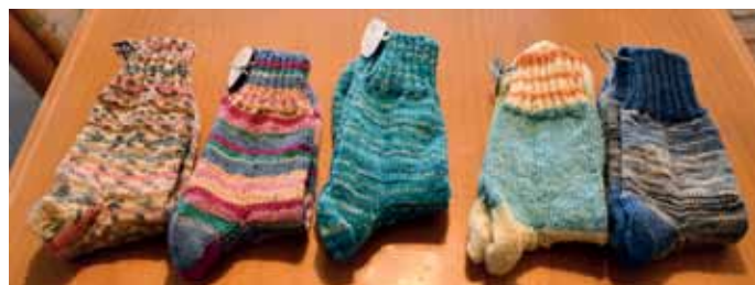
Die ersten fünf Paar Wollsocken des neuen Jahres.

für ein Paar. Es eilt ihr nicht, sie lässt sich Zeit – und gerade so ist es für sie eine runde Sache. „Die Wollreste sind versorgt, ich bin beschäftigt, und im Erich-Reisch-Haus haben sie Freude.“