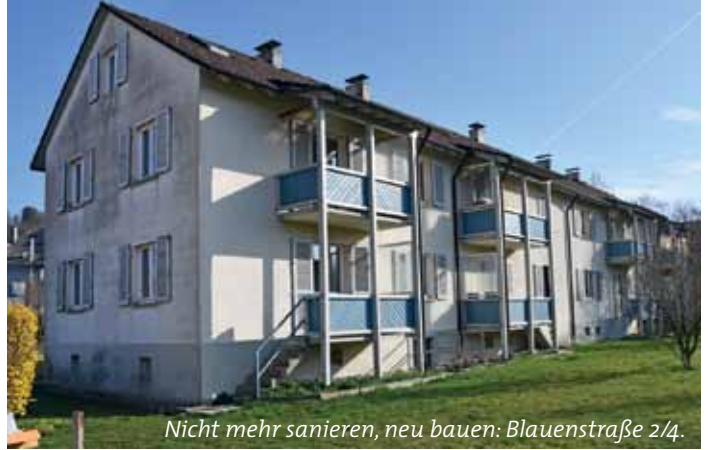
Nicht mehr sanieren, neu bauen: Blauenstraße 2/4.

Den heutigen Mietern der Blauenstraße 2/4 bietet die Wohnbau Lörrach ein alternatives Zuhause mit in der Regel höherer Wohnqualität als bisher an. Die Hälfte der Mieter sind bereits umgezogen, ihre alten Wohnungen stehen nun leer.