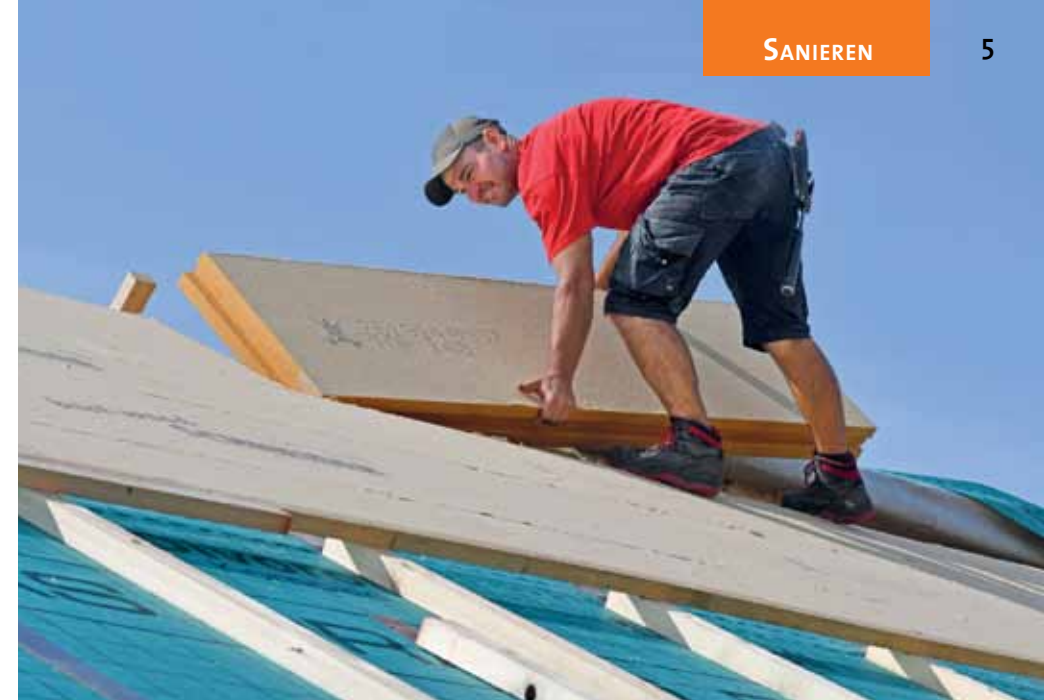
Zimmerleute haben in der Blauenstraße für neue, gut gedämmte Dächer gesorgt.

Zuoberst sind wie immer die Zimmerleute am Werk. Den alten Dachstuhl kon-