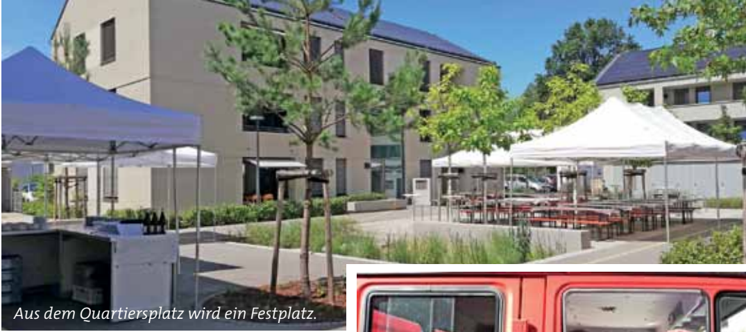
Aus dem Quartiersplatz wird ein Festplatz.