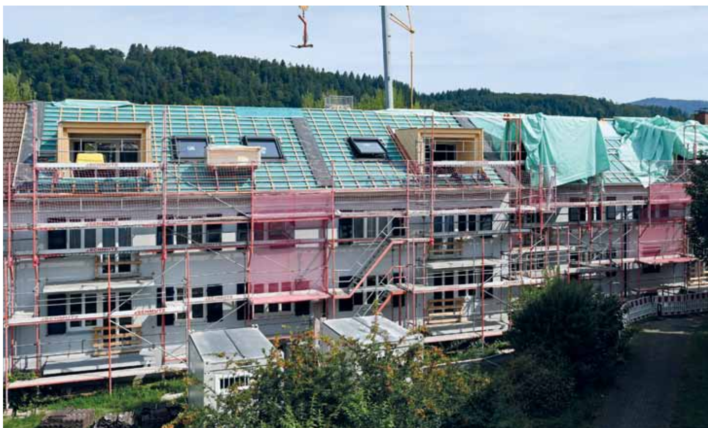
Diese Hauszeile an der Blauenstraße in Schopfheim wird saniert. Gauben verhelfen mit zu attraktiven Wohnungen unter den Dächern.

Um mit dem Sanieren markant Energie zu sparen, genügen moderne Fenster, gedämmte Dächer und ein Nahwärmenetz: So steht es im gemeinsam mit Fachingenieuren entwickelten Energiekonzept. Wärme und heißes Wasser werden mit einem Blockheizkraftwerk im Lusweg 105 gewonnen, dem Nachbarhaus. Die Zeile Blauenstraße 34-38 wird in diesen Tagen komplett ins Netz eingeknüpft sein.